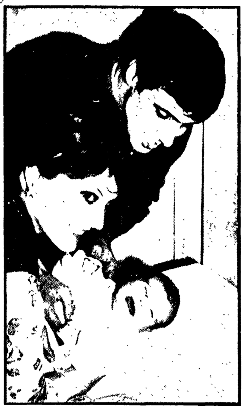
MILANO, 22. Adriano Celentano è diventato padre per la seconda volta. Il lieto evento porta la data di questa mattina, con un certo anticipo sul previsto.

La nascita del nuovo figlio, infatti, è mantenuta segreta dal cantante, assolutamente terrorizzato dall'idea di vedersi attorno cronisti e fotografi. Ufficialmente, insomma, Claudia Mori, ovvero la signora Celentano « è fuori Milano ».