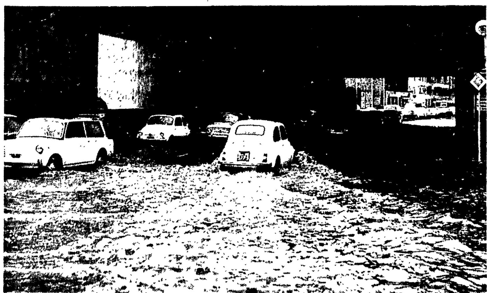
Un tratto della via Tuscolana allagato ieri mattina: le macchine transilano a fatica. Molte, in altre zone della città, sono rimaste bloccate, ed il traffico è piombato nel caos.