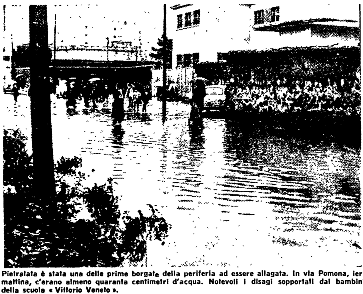
Pietralata è stata una delle prime borgate della periferia ad essere allagata. In via Pomona, ieri mattina, c'erano almeno quaranta centimetri d'acqua. Notevoli i disagi sopportati dai bambini della scuola «Vittorio Veneto».

Roma è presto diventata una grande pozzanghera. Il traffico è «impazzito» e dovunque si sono verificati allagamenti: in via Tiburtina è stata invasa da oltre un metro d'acqua; al Portuense (dove è straripata la marrana di via Afrogasino), dove numerose vetture sono rimaste allagate, molte auto sono state distrutte; in via Anagnina, la strada è stata invasa da oltre un metro d'acqua; al Portuense (dove è straripata la marrana di via Afrogasino), dove numerose vetture sono rimaste allagate, molte auto sono state distrutte; in via Anagnina, la strada è stata invasa da oltre un metro d'acqua; al Portuense (dove è straripata la marrana di via Afrogasino), dove numerose vetture sono rimaste allagate, molte auto sono state distrutte.