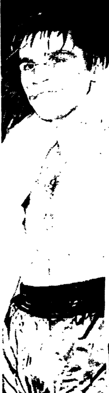
Il campione d'Europa dei pesi medi, Nino Benvenuti, tornerà sul ring del Palazzo dello Sport della capitale il 2 dicembre prossimo per incontrare lo slalomista Fer Hernandez.