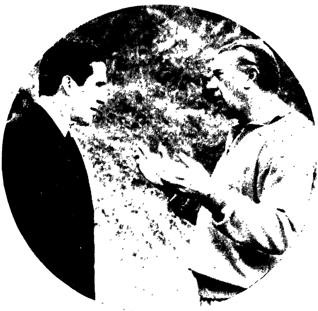
HELENI HERRERA è giunto a Napoli; VALCAREGGI riferisce al commissario tecnico «in pectore» della Nazionale sulla situazione

La pioggia e il fango ostacoleranno il bel gioco, ma sul piano agonistico l'incontro s'annuncia valido — Il giudizio dei giocatori Sarti: pensare al futuro della Nazionale