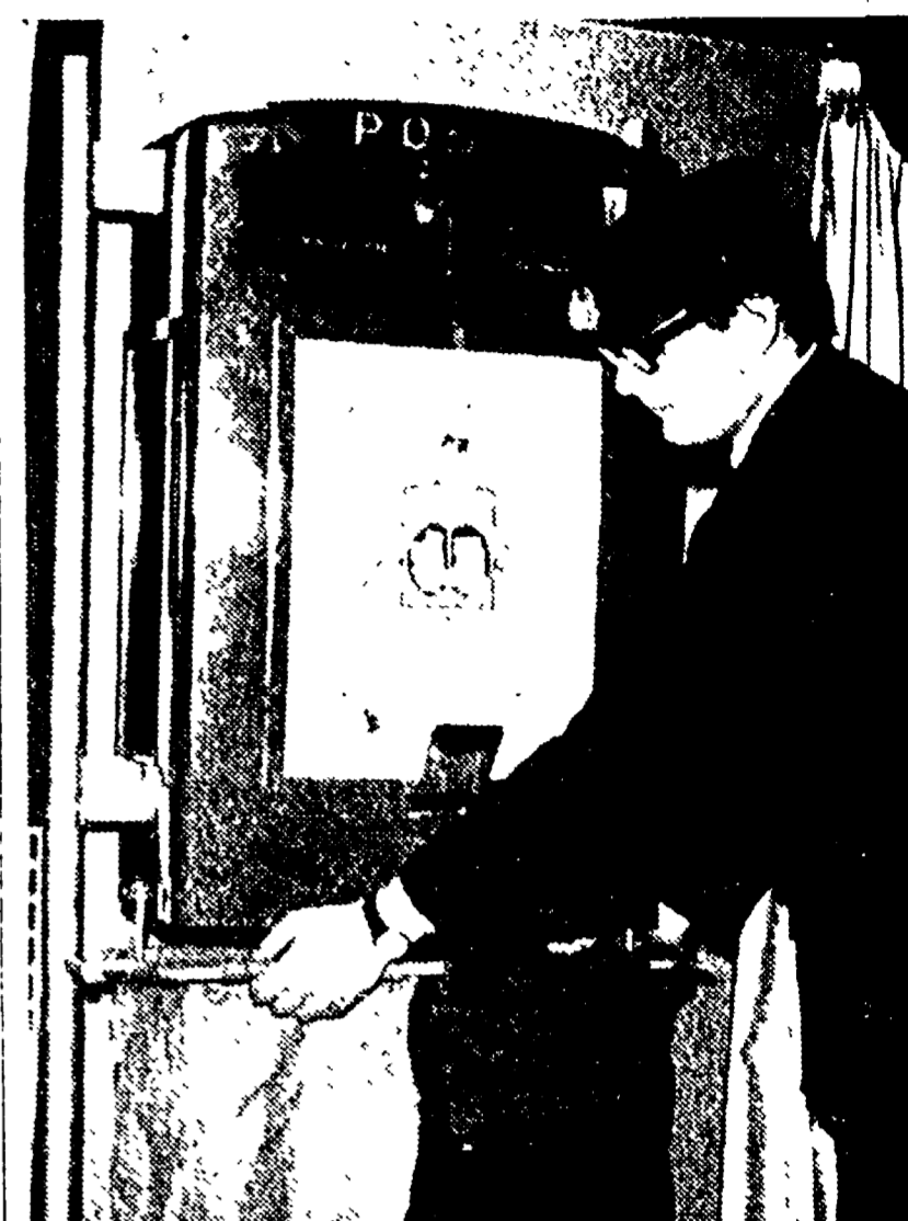
Le nuove cassette delle lettere

Che il numero dei postali tessere non sia adeguato alla mole di lavoro che oggi sono costretti a distribuire lo dimostra un dato fornito dal Ministero delle poste: secondo cui quest'anno non bastano a distribuire 10 mila lettere in più rispetto al 1956.