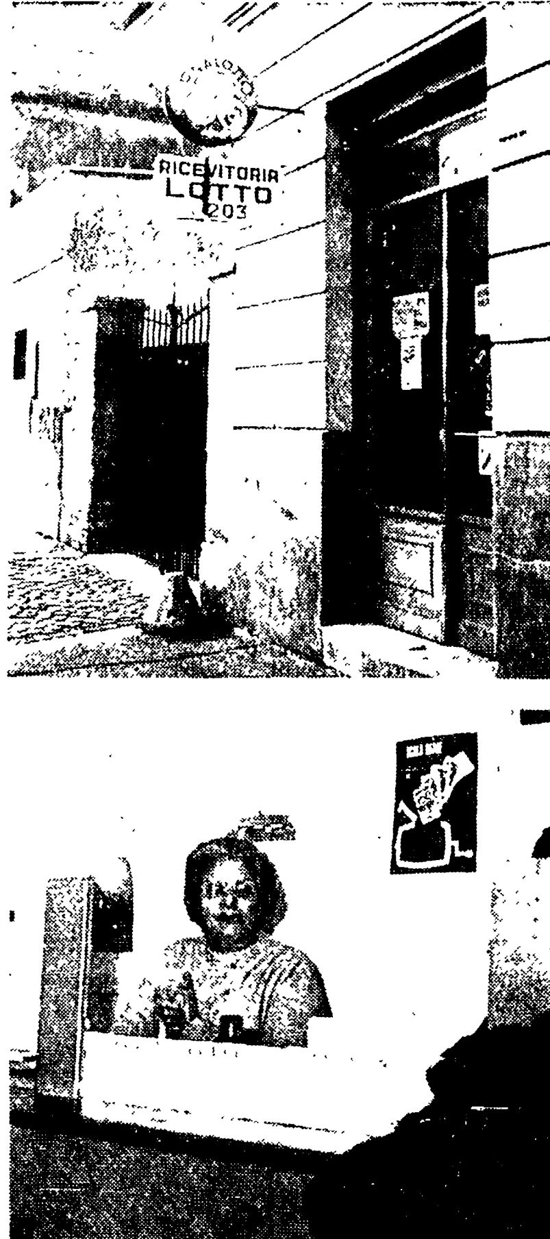
La ricevitoria del Lotto di via Alberto Mario. Sotto, l'interno del botteghino con una delle impiegate.

Il cliente abituale del banco di Monteverde giocava al raddoppio (per telefono) - Ma ora che avrebbe vinto, le bollette le ha un altro - L'intervento dell'Intendenza di Finanza ha bloccato la vincita in attesa di chiarire l'episodio