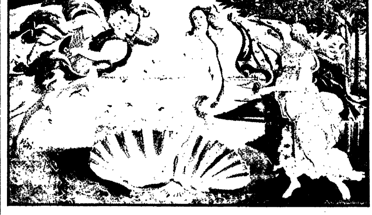
Sandro Boticelli, «Nascita di Venere»

«Francesca, il «colore» dei Veneti, lo «sfumato» di Leonardo, lo «schacciato» di Donatello, e viceversa) possono costituire un serio incentivo alla superficialità.