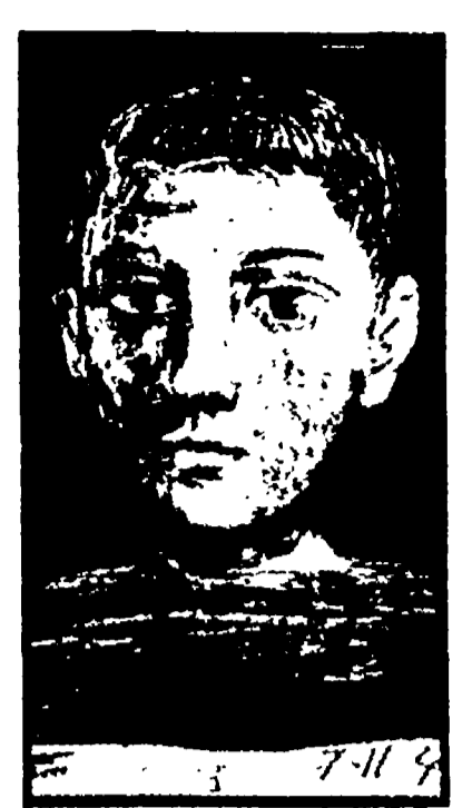
Pablo Picasso, «Testa»