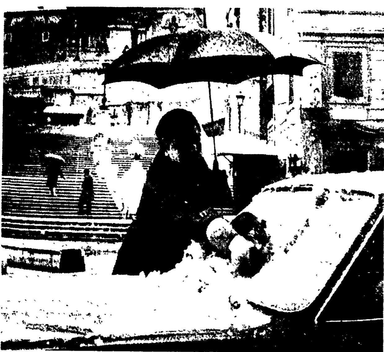
La neve a Monte Mario e piazza di Spagna

Retami con la neve. E' cominciata a cadere verso le dieci e trenta, riuscendo tuttavia ad imbiancare solo la parte più alta della città. I fiocchi sono caduti fitti per almeno tre ore, mischiandosi poi con una sottile pioggia che nel pomeriggio è riuscita a far scomparire la coltre bianca che in alcuni punti aveva coperto, anche con una certa consistenza, tetti, alberi e strade, specialmente a Monte Mario, nella zona della Tomba di Nerone, alla Capannelle, a Tor Sapienza e Ponte Mammolo.