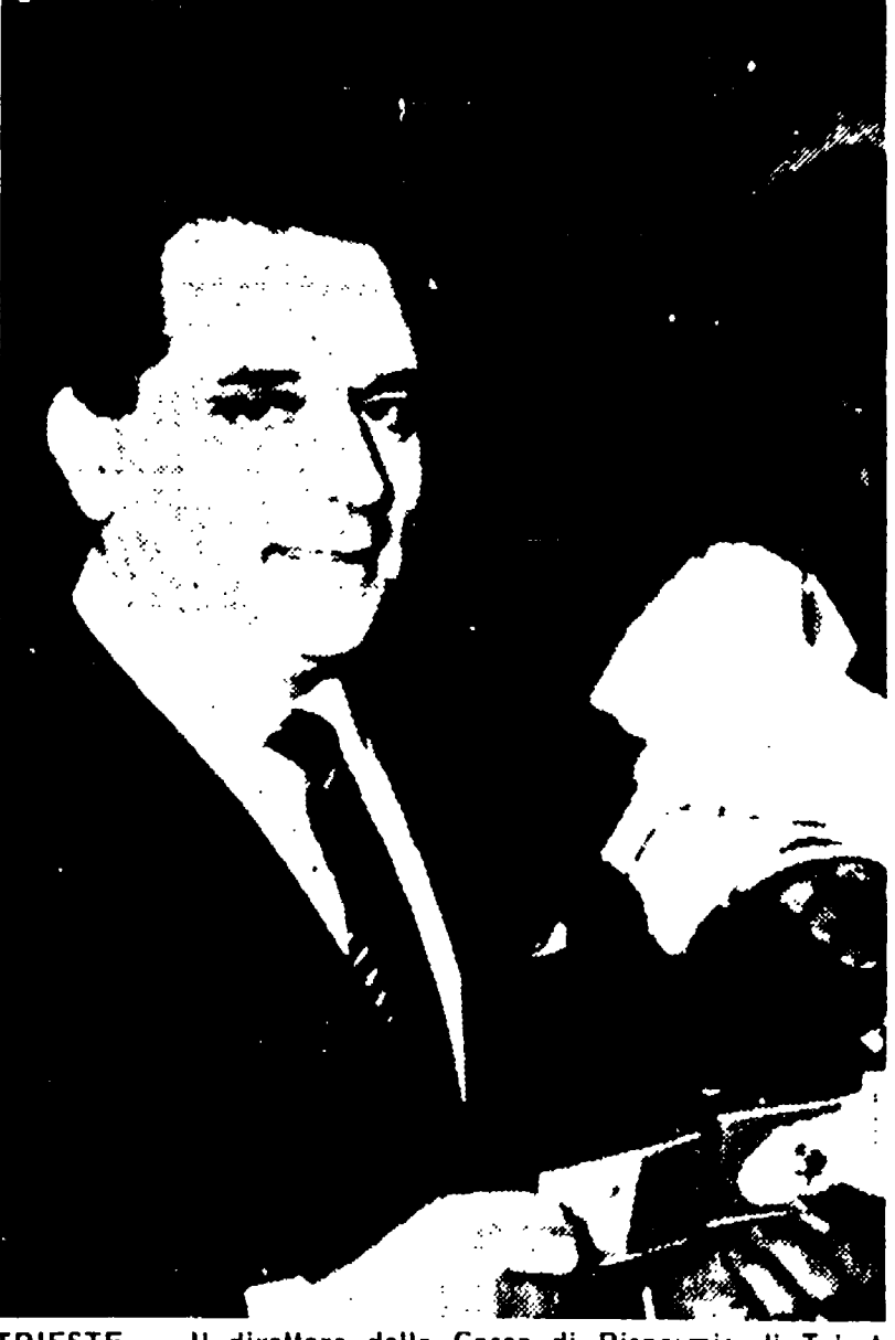
TRIESTE — Il direttore della Cassa di Risparmio di Trieste con la matrice del biglietto vincente 150 milioni