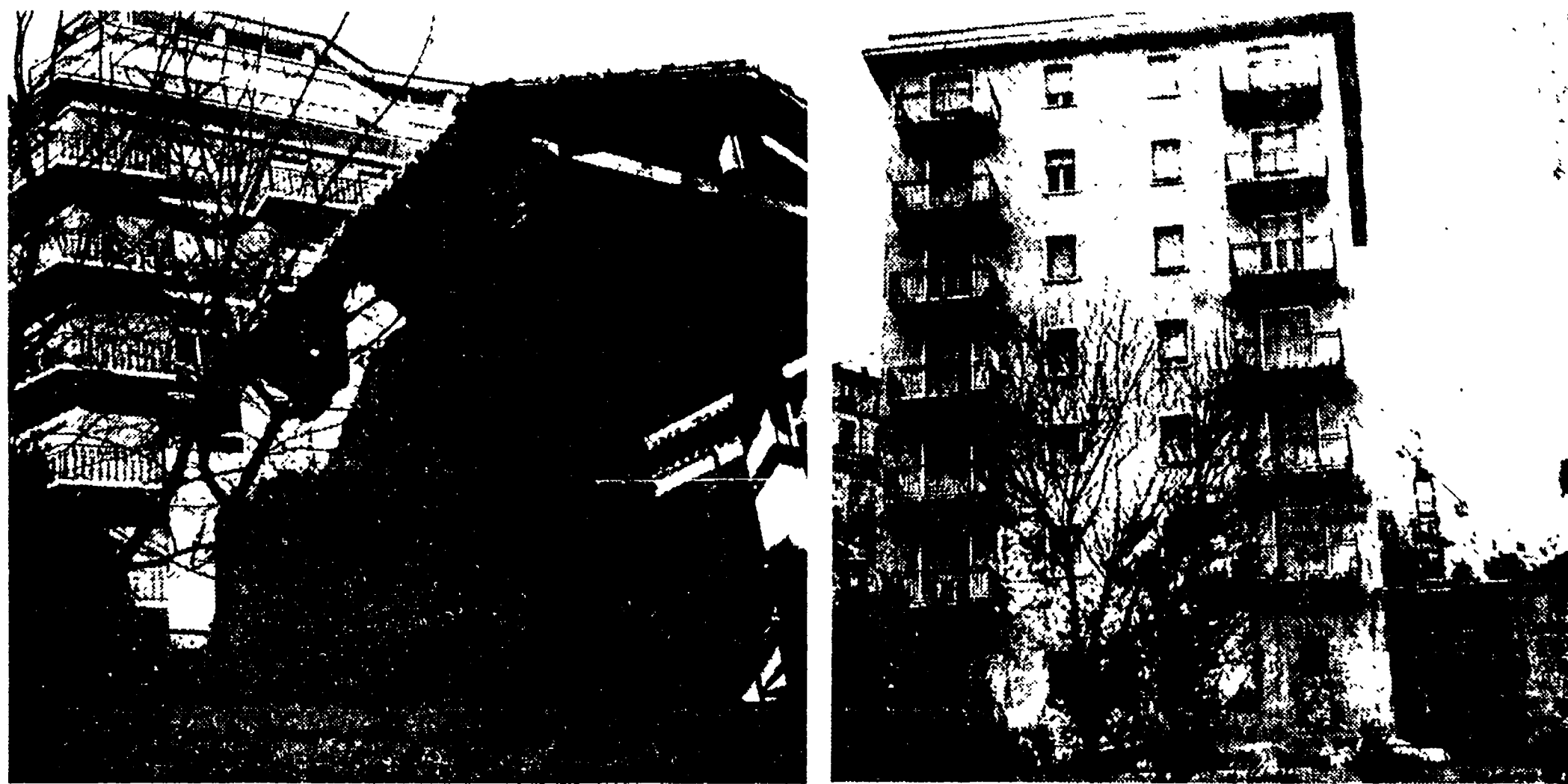
Il palazzo Verlingia soffoca letteralmente l'antico tempio romano. È stato costruito in violazione della licenza che già di per sé stessa era in contrasto con le norme di salvaguardia del patrimonio archeologico

Occorre intervenire subito nella speranza che si sia ancora in tempo