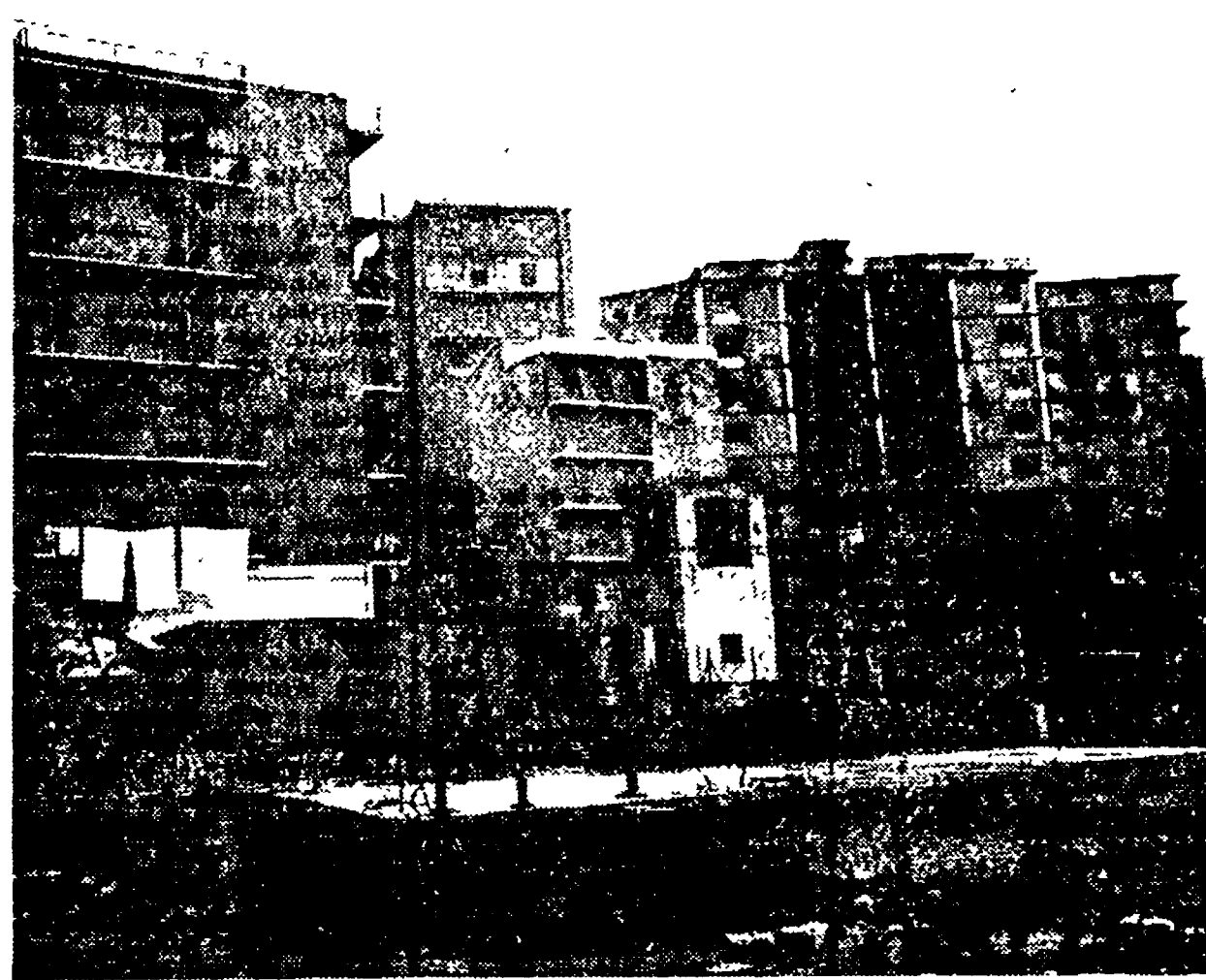
Zona in cui, secondo la relazione Balboni, è vietata ogni costruzione. In primo piano è visibile quello che resta dell'edificio della cooperativa dei maestri elementari, che è crollato