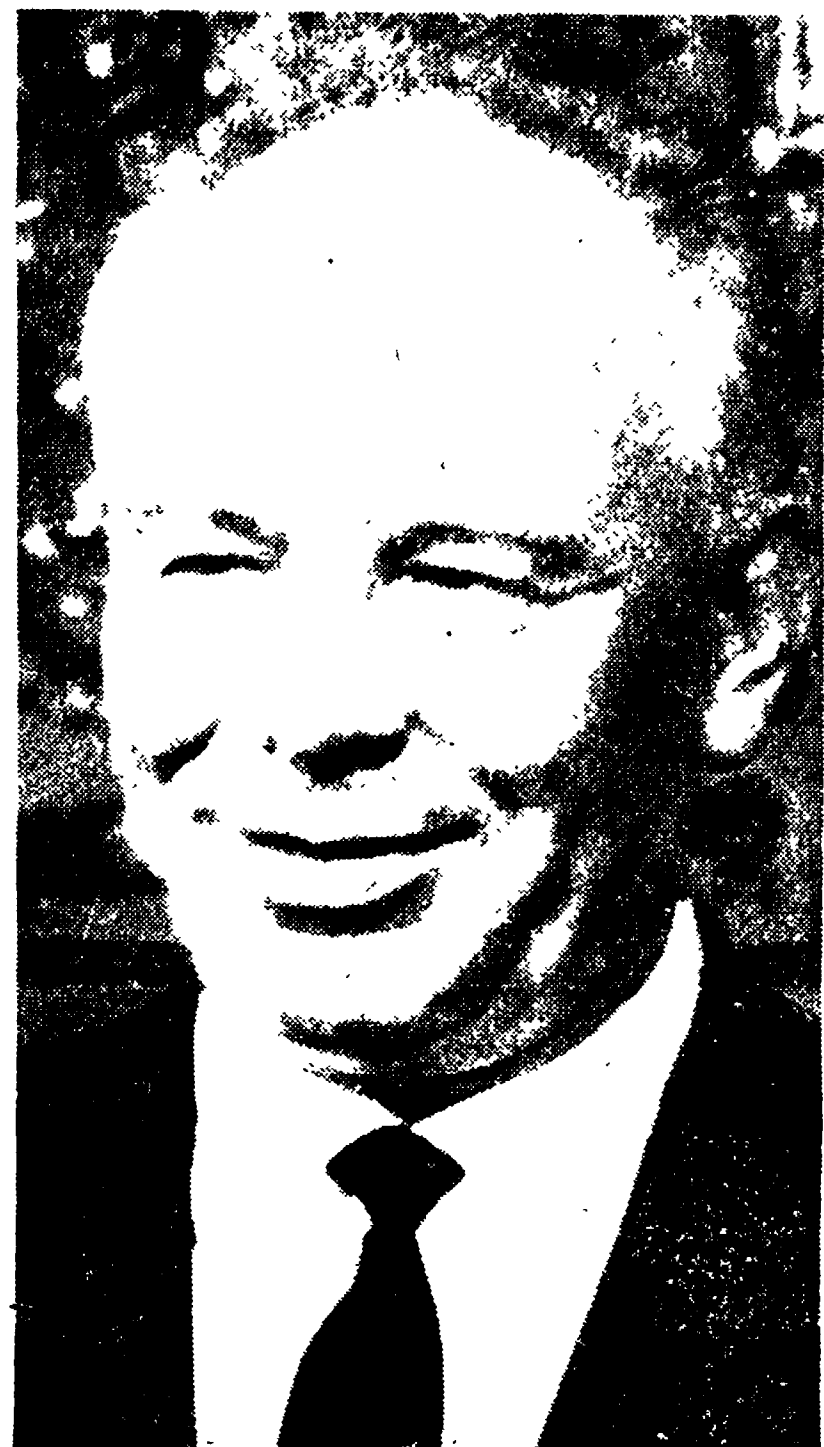
Il Presidente sovietico Podgorni