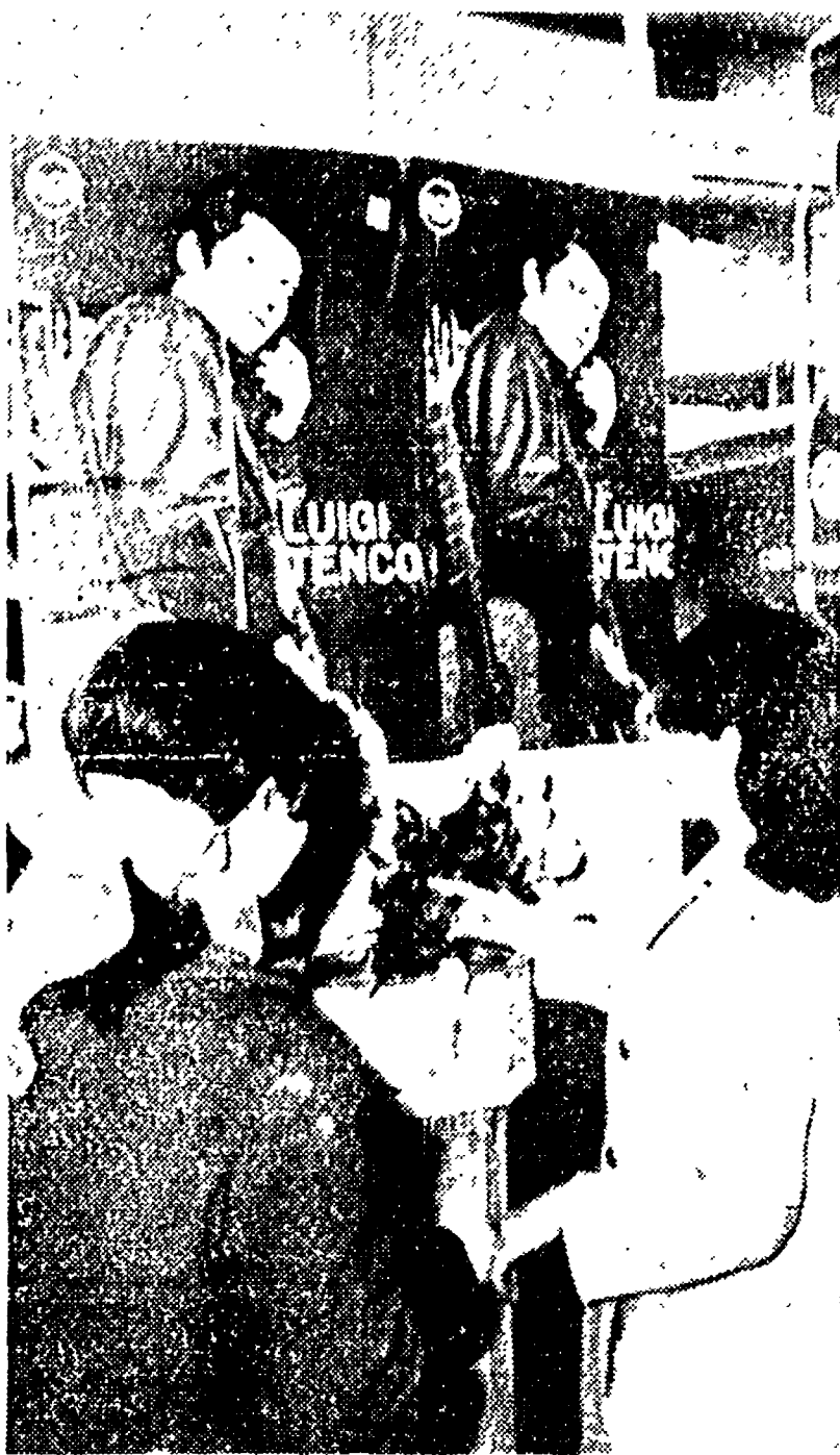
SANREMO - Due giovani ammiratrici di Luigi Tenco depongono fiori sotto alcuni maglionesi che ritraggono il cantante