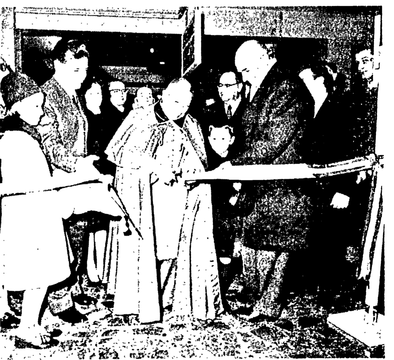
Sabato 21 gennaio alla presenza del Sottosegretario alla Presidenza del Consiglio, On.le Angelo Salizzoni e delle autorità religiose e cittadine di Bologna, è stata inaugurata ufficialmente la nuovissima esposizione «Palazzetto del Mobile» che fa parte della catena dei Supermercati Mobili Italiani.