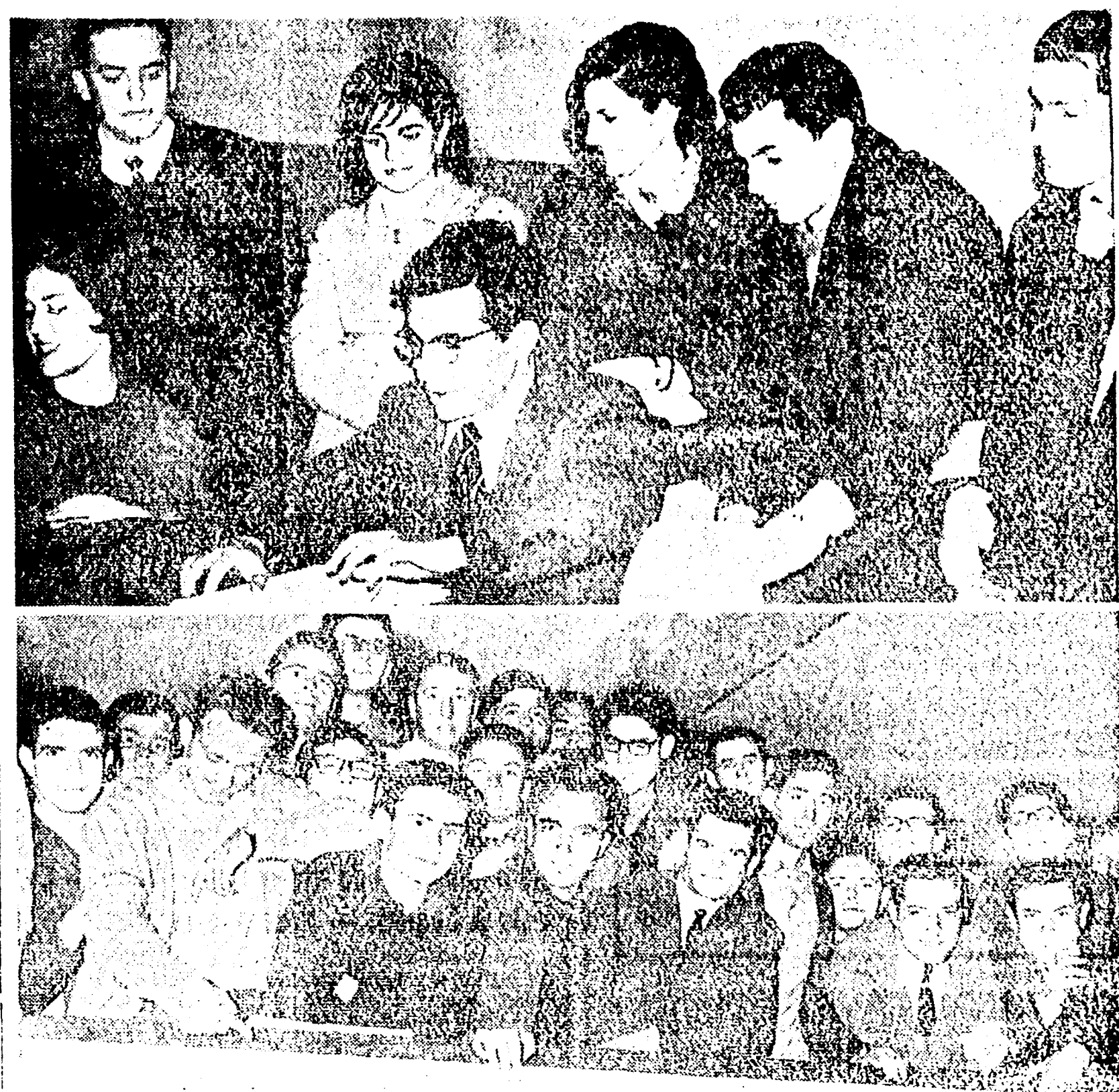
CHIMICA L'ISTITUTO DI STUDENTI OCCUPANO DI CHIMICA

A due anni dalla formazione della Giunta popolare