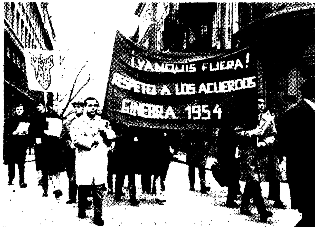
ZURIGO — Manifestazione a Zurigo, sabato pomeriggio, contro l'aggressione americana al Vietnam. Vi hanno partecipato oltre mille persone. Tra i manifestanti numerosi gli immigrati spagnoli e di altre nazionalità. Nella foto: un gruppo di manifestanti reca uno striscione sul quale è scritto in spagnolo: «Fuori gli yankee! Rispettare gli accordi di Ginevra del 1954». In secondo piano un cartello con la sagoma di una bomba d'aereo, entro la quale è scritto in tedesco: «In nome della libertà».