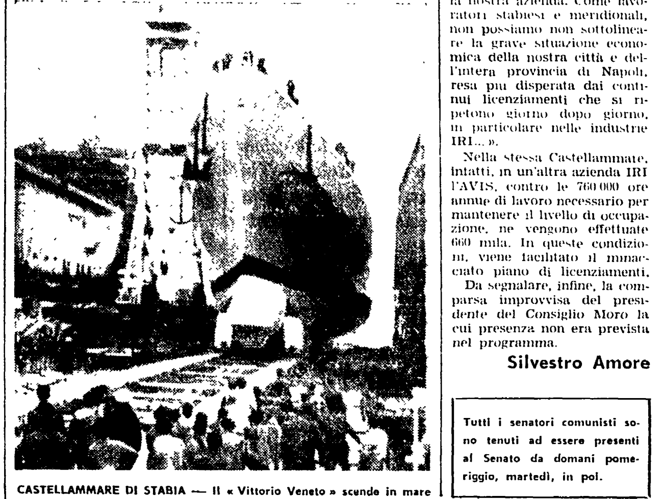
CASTELLAMMARE DI STABIA — Il « Vittorio Veneto » scende in mare