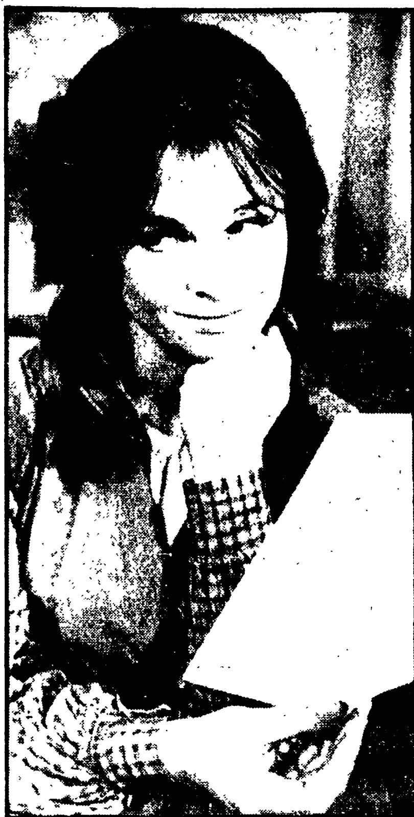
LONDRA - Julie Christie festeggerà oggi San Valentino inviando al suo partner Peter Finch un vecchio biglietto che uno sconosciuto innamorato mandò alla sua ragazza il 14 febbraio del 1865. I due allora interpellano insieme, in questi giorni, in Inghilterra, il film «Far from Madding Crowd» (Lontano dalla folla di Madding). Nella foto: Julie mostra lo storico biglietto.