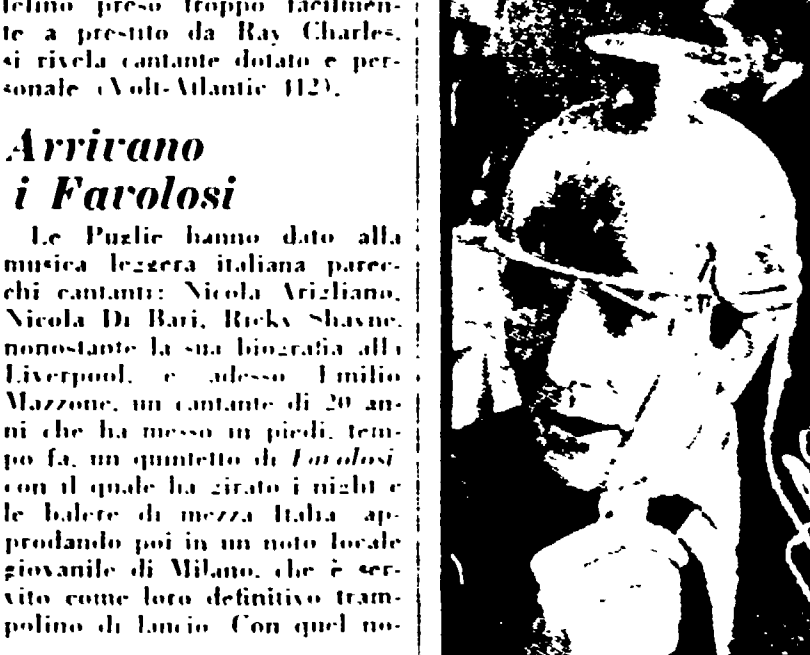
LONDRA - Albert Finney, lo allora regista popolare dal successo di «Tom Jones», di cui era protagonista, ha esordito come regista dirigendo («Interpretando») «Charlie Bubbles», un film tutto da ridere. Nella foto: l'attore in una scena che ricorda chiaramente le «comiche» dei vecchi tempi.