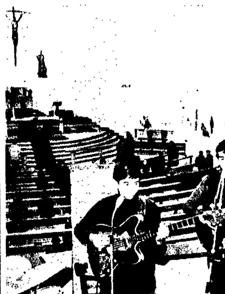
KASSEL (Germania) — Sostituito il tradizionale organo con un complesso musicale beat nella chiesa di San Bonifacio. L'innovazione è stata lanciata da padre Moesch, pastore della chiesa, nella speranza di attirarvi un maggiore numero di giovani.