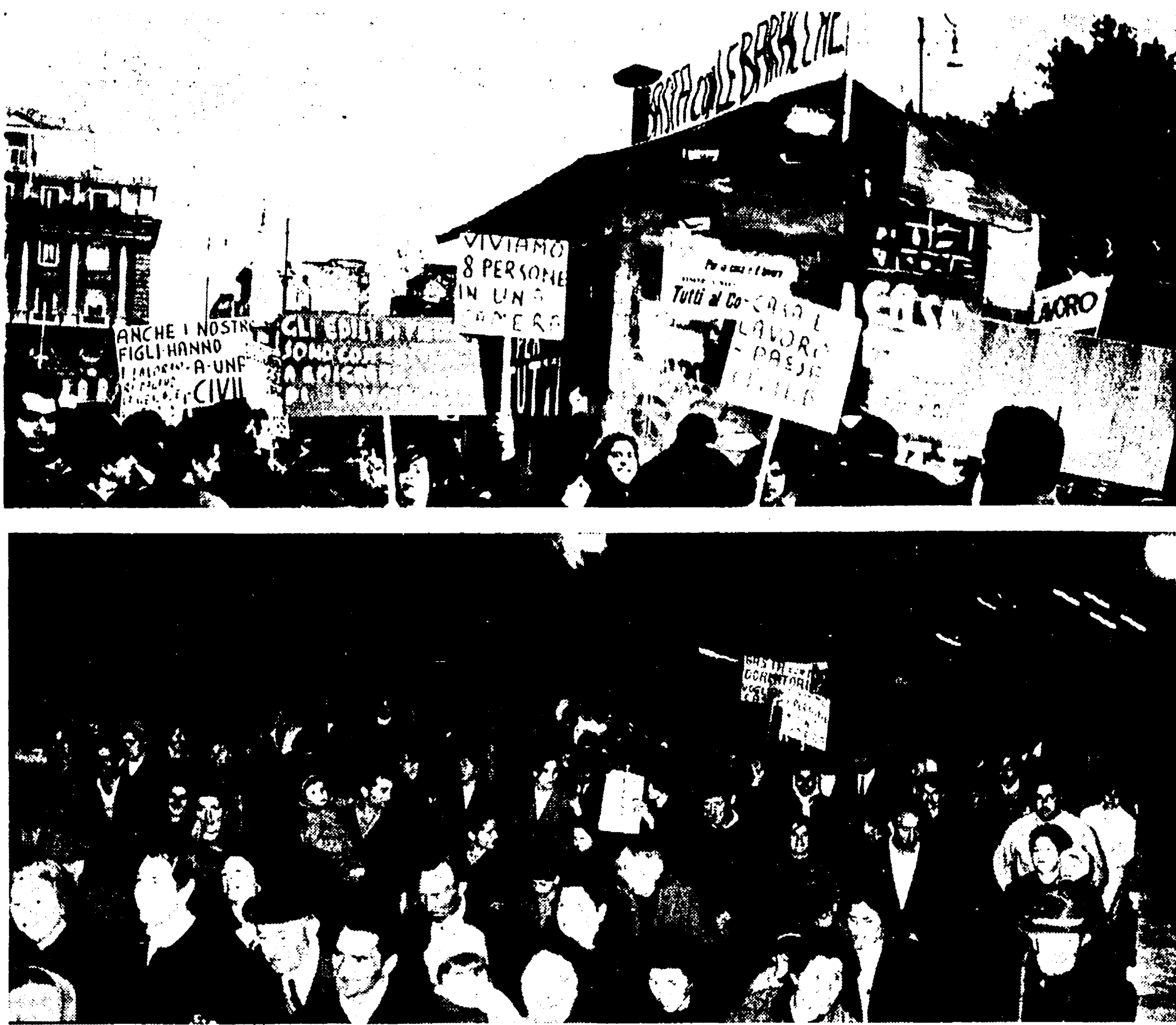
Due momenti della grande manifestazione popolare dei baraccati

Centinaia di famiglie di baraccati, uomini, donne, bambini, edili disoccupati, centinaia di giovani e ragazze con cartelli e striscioni di protesta hanno bloccato, ieri pomeriggio, il centro della città e hanno poi invaso la piazza del Campidoglio mentre era in corso la seduta del consiglio comunale. Il dramma della casa e del lavoro è così esplosivo, in tutta la sua gran vita, dinanzi agli occhi di migliaia di cittadini. Le famiglie che avevano raccolto l'appello delle Consulte popolari per dare vita alla grande manifestazione del Colosseo sono giunte da tutte le borgate, dai borghetti, dai quartieri popolari, da Ardea, da Fiumicino, dalle pen-