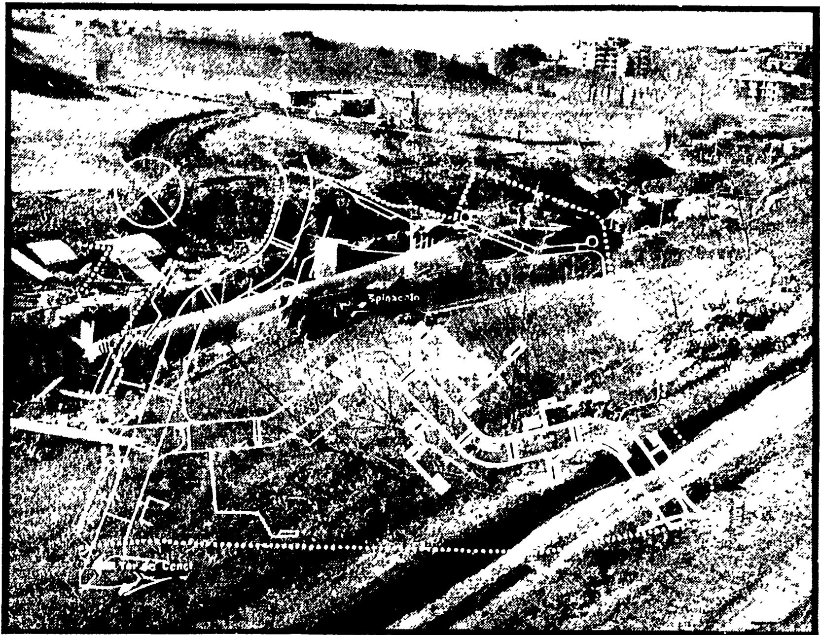
Una veduta dei lavori per il collettore a Spinaceto. Il tratto bianco indica lo schema di urbanizzazione del quartiere-pilota della «167».