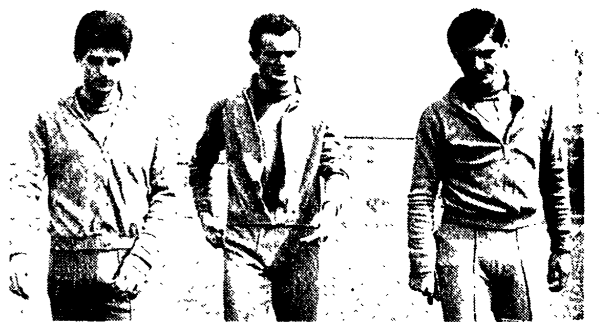
Rivera, Mazzola e Bulgarelli forse si ritroveranno insieme nella nazionale di Herrera

5) la squadra rientrerà a Roma da Nicosia giovedì 23 marzo, entro le 12. I giocatori rimarranno a disposizione ed alloggieranno presso gli impianti del centro sportivo dell'Acqua Acetosa in Roma fino a lunedì 27 marzo al termine della gara con il Portogallo. Trattandosi di gara amichevole, in caso di necessità, potranno essere effettuate ulteriori convocazioni.