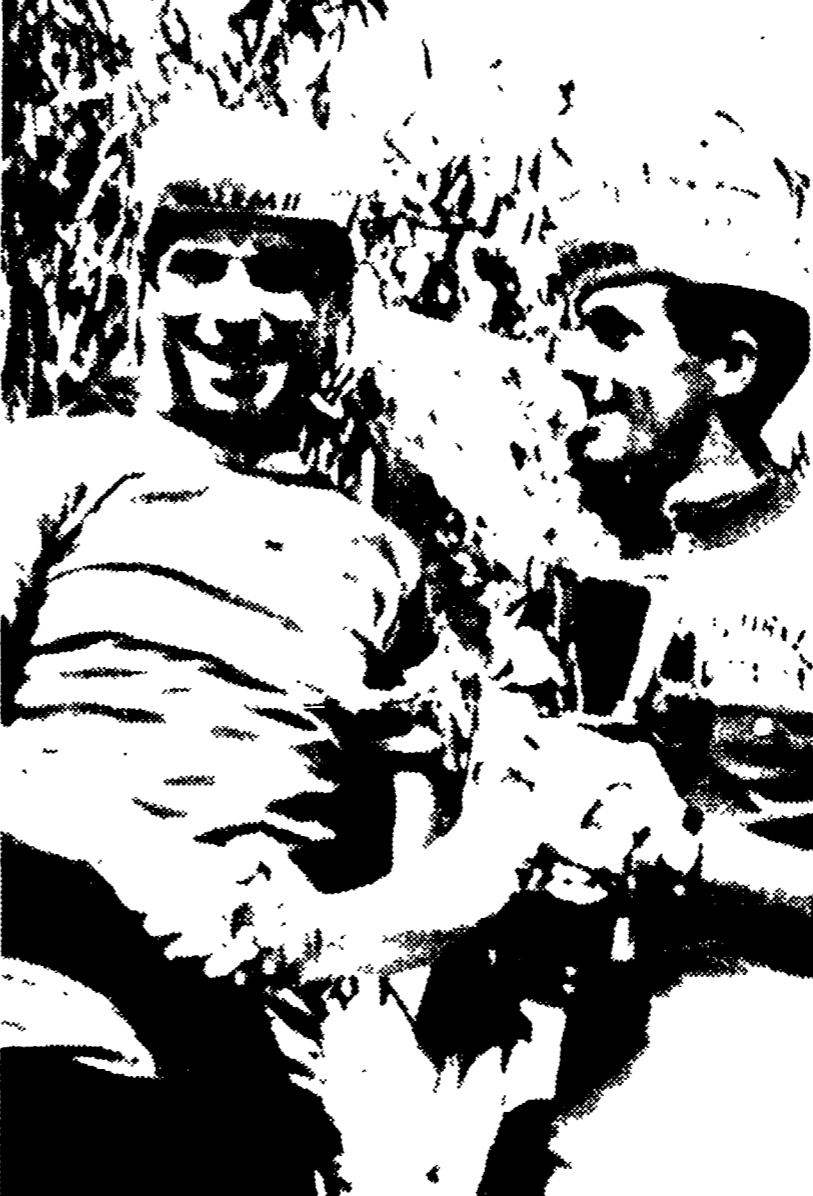
Van Looy e Armani: il primo ha vinto la seconda tappa del Giro di Sardegna e il secondo si è aggiudicato il successo finale entrando nella fuga promossa dal vecchio Rik

Infatti ad eccezione del Foggia che pareggiando con la Juve ha lasciato solo all'ultimo posto il Lecce) tutte le altre pericolanti sono incappate in una giornata terribile: a cominciare dal Venezia per finire con il Lanerossi.