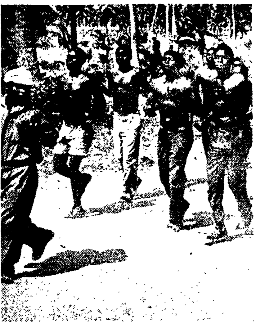
Esercizio di alcune reclute