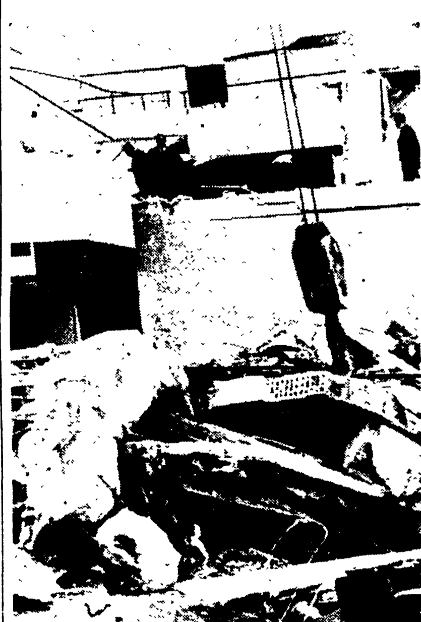
RAVENNA - I resti della palazzina distrutta e sotto la quale sono morti i 5 turisti svizzeri (Telefoto)