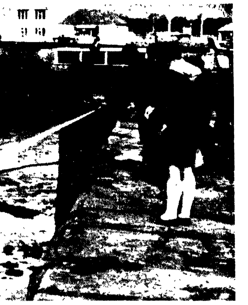
LAND'S END, 31.

Il grave incidente ha suscitato (frattanto una serie di polemiche; da una parte il governo britannico ha annunciato una propria iniziativa per la convocazione dell'organizzazione consultiva marittima internazionale allo scopo di