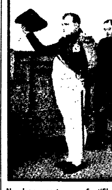
Napoleone parte per Sant'Elena