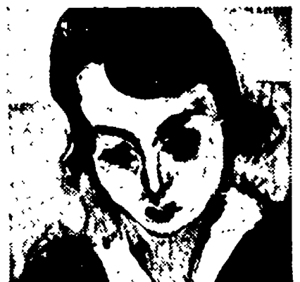
CARLO CASSOLA STORIA DI ADA