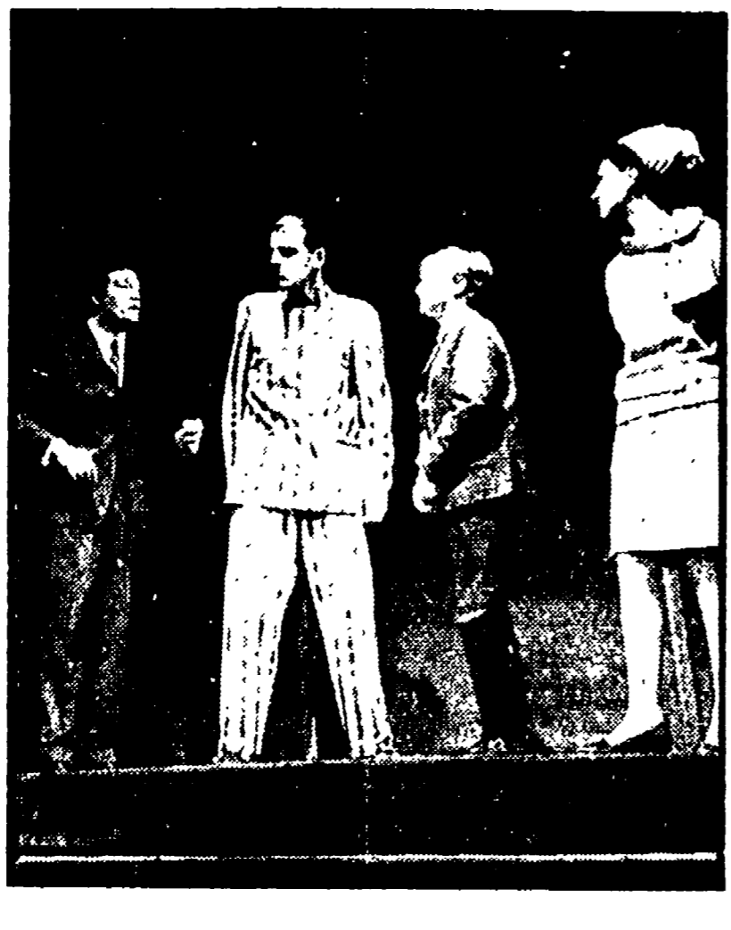
La commedia di Georges Michel in un mordente e attuale adattamento