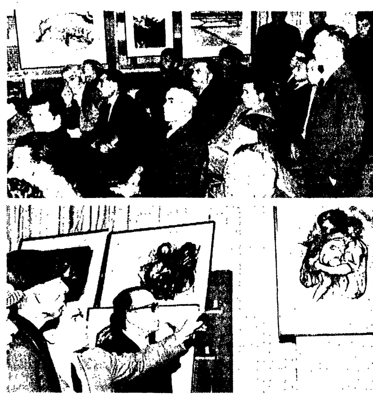
dei segni e dei colori — il dramma del Sud, il dramma dell'oppressione e dello sfruttamento che si ritrova nel bracciantato dall'antica tradizione socialista.

E' stata la FGCI a promuovere l'incontro alla Biblioteca civica — Una esperienza interessante