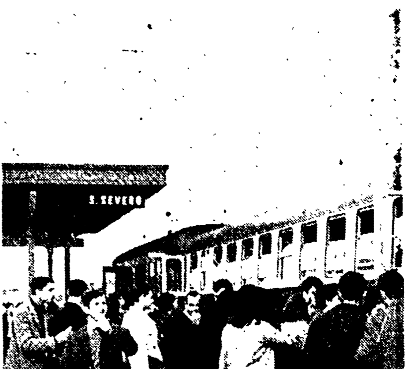
Studenti prendono il treno per recarsi a scuola