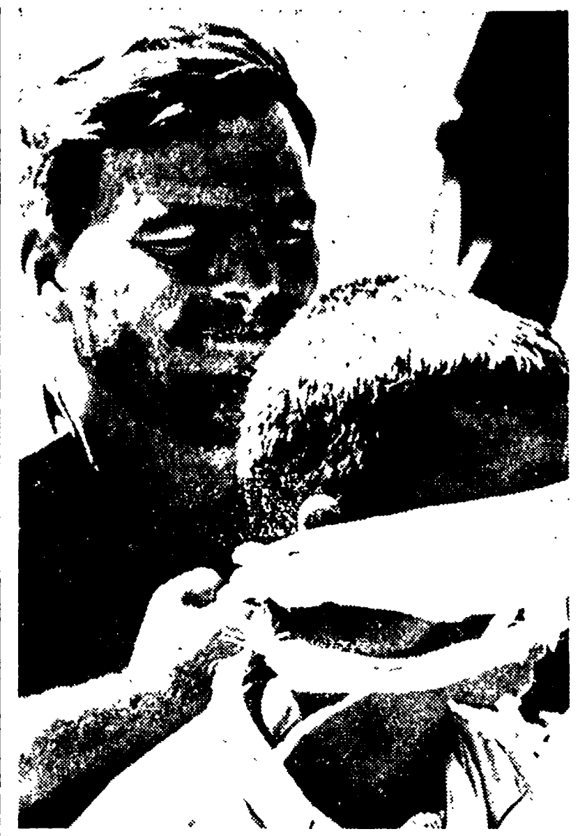
DA NANG — Un soldato americano lega una benda sugli occhi di un pariglano vietnamita catturato