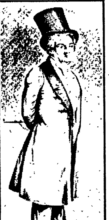
Beethoven in un ritratto del 1824, tre anni prima della morte.