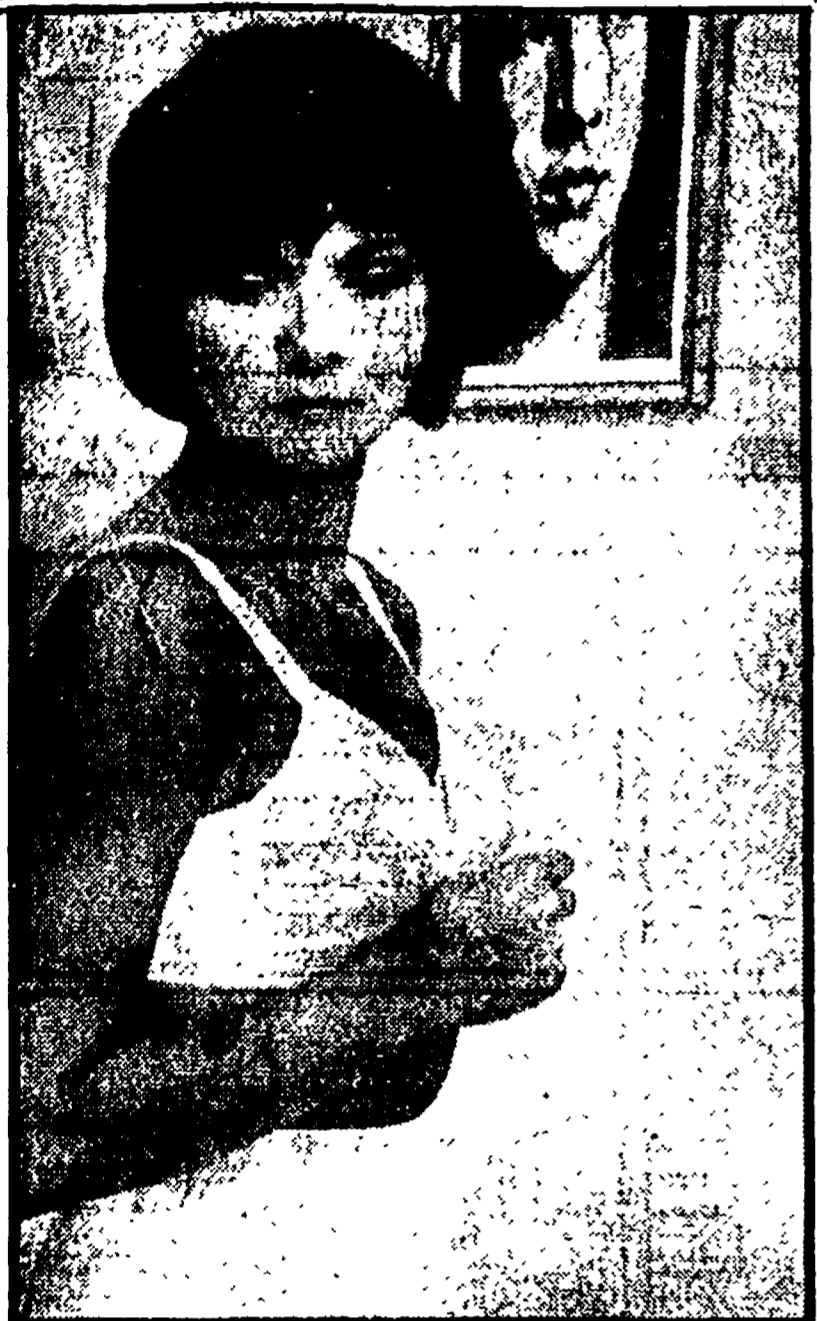
PARIGI — Macha Meril (nella foto) e Jean Rochefort sono i protagonisti del film « Mars en carême »...