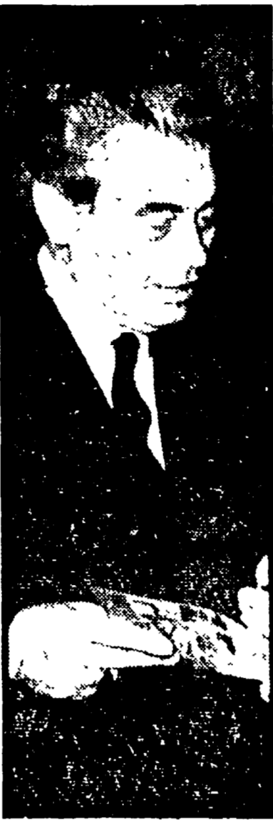
HANOI — Joris Ivens (nella foto) è stato ricevuto, in questi giorni, dal primo ministro del Vietnam del nord, Pham Van Dong...