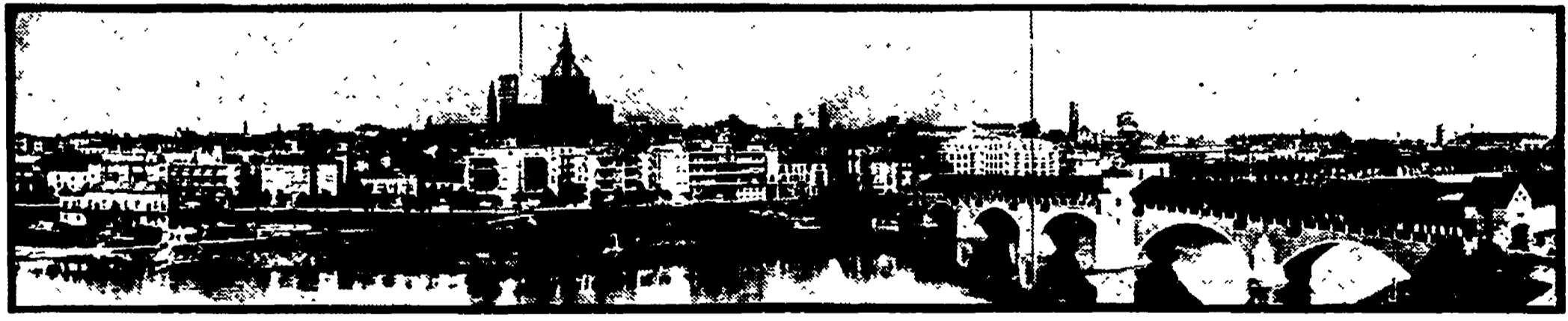
PAVIA - L'antica città degradante verso il Ticino è scomparsa dietro uno squallido muro di nuove costruzioni sorte lungo il fiume

Studiosi di tutto il mondo terranno un convegno sulla « capitale barbara » — Ma l'incuria per i tesori d'arte e la speculazione edilizia hanno deturpato e reso irriconoscibile la città medievale