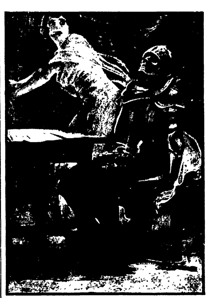
Due manifesti esposti alla mostra «Grafica Ricordi» di Palazzo Barberini a Roma