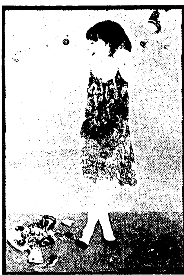
Renzo Vespignani: « Ritratto di Tina » (1967)