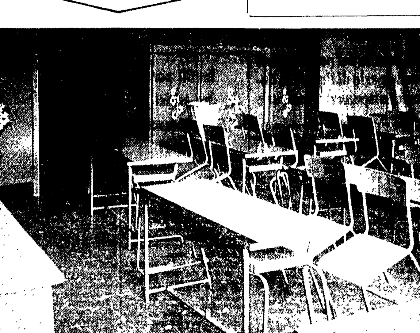
Nella scuola elementare superaffollata «San Francesco d'Assisi» di Ascoli... il sovraffollamento è tale da impedire di supplire all'insufficiente spazio...