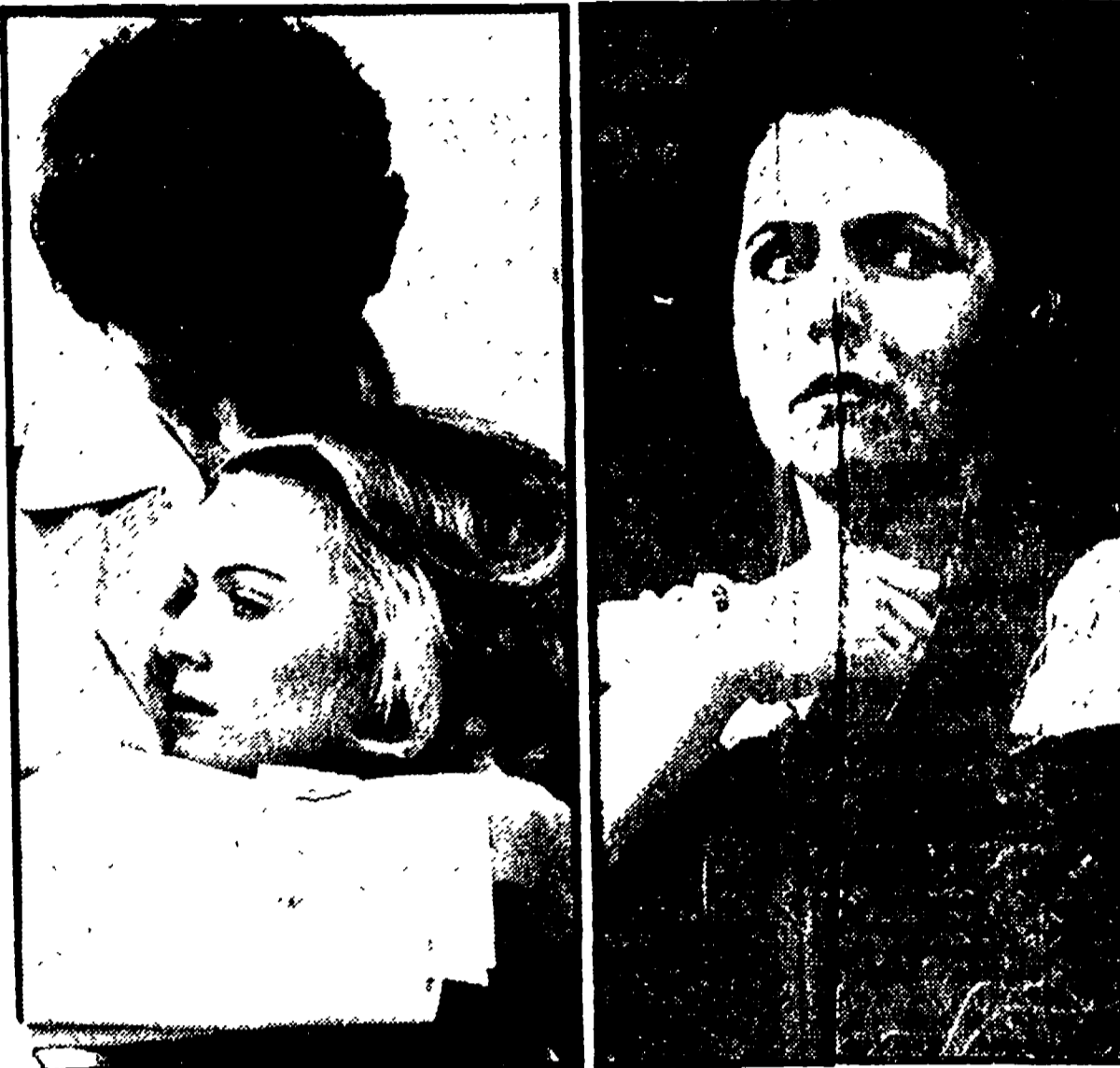
«Lo sconosciuto di Shandigor» e Galip Viscnevskala in una scena di «Katerina Izmailova»

richiamo alla tragedia, che da essa si esprime, fra tanto futile grare a vuoto, cui la bellezza delle immagini non giunge ormai più a far velo.