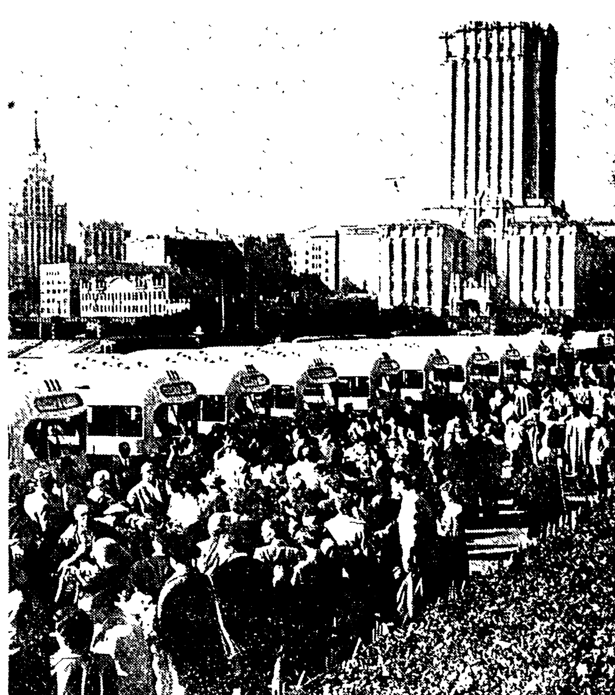
Per liberare il commerciante di Nuoro

Anche l'URSS, nei prossimi anni, sarà invasa da migliaia di turisti automobilisti che percorreranno in ogni senso, settemila chilometri di strade sovietiche, ogni aperte al transito. A che punto è la preparazione in URSS, costerà circa 40 lire al litro e la «super» non oltrepassa le 70 lire in URSS - è noto - non si può viaggiare in URSS, come si viaggia in Europa. L'automobilista sorpreso alla guida di un veicolo non può essere multato, di solito, di un rublo, il ritiro della patente è previsto quando il conducente dell'auto abbia raggiunto le 30 infrazioni al codice della strada che è quasi simile al nostro. La severità della polizia della strada è, invece, molto più accentratrice che da noi. Chi ha percorso le strade che vanno verso Mosca testimonia, particolarmente domenica, come il ritorno degli automobilisti e dei motociclisti verso la città, avveniva sotto stretto controllo alle uscite cittadine che scavalcano puntualmente di ottanta chilometri. Il traffico, comunque, è stato, per ora, limitato alle zone di Mosca, e il ritorno degli automobilisti è stato, per ora, limitato alle zone di Mosca, e il ritorno degli automobilisti è stato, per ora, limitato alle zone di Mosca.