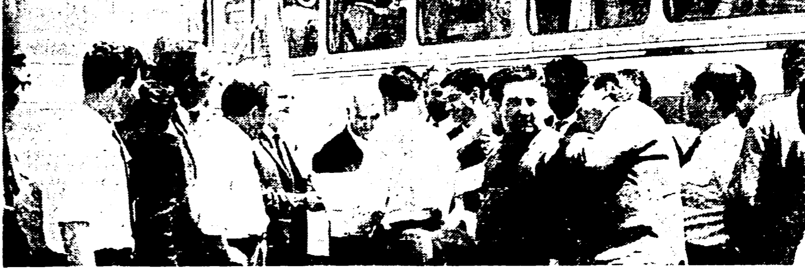
I lavoratori della CIASA mentre firmano la bandiera della pace

All'Università continua la lotta del personale non insegnante - Domani sciopera il Poligrafico