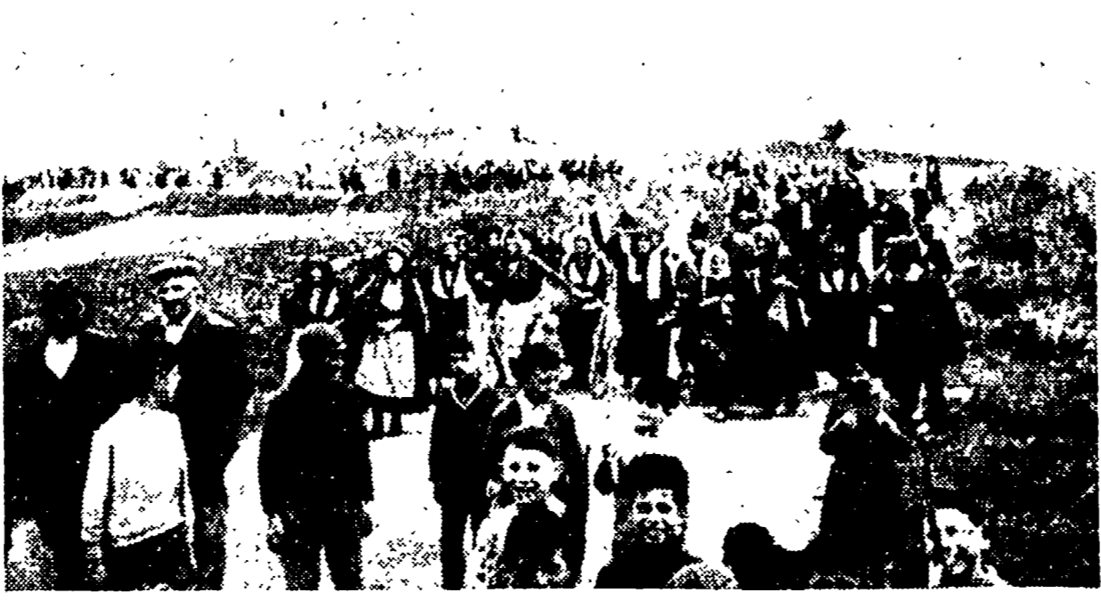
AVIGLIANO — In marcia verso l'occupazione del bosco di Montecaruso

AVIGLIANO - Nonostante il forte schieramento dei CC