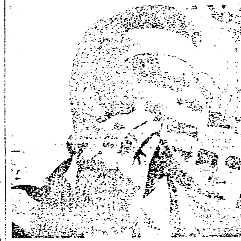
Manno messo Cassius Clay in prigione. Le autorità americane non possono ancora arrestare il campione per il rifiuto di vestire la divisa militare, perché la procedura è lunga. Ma si sono riflette appigliandosi a una multa di 75 dollari. Clay è stato rimesso in libertà su cauzione di 75 dollari.