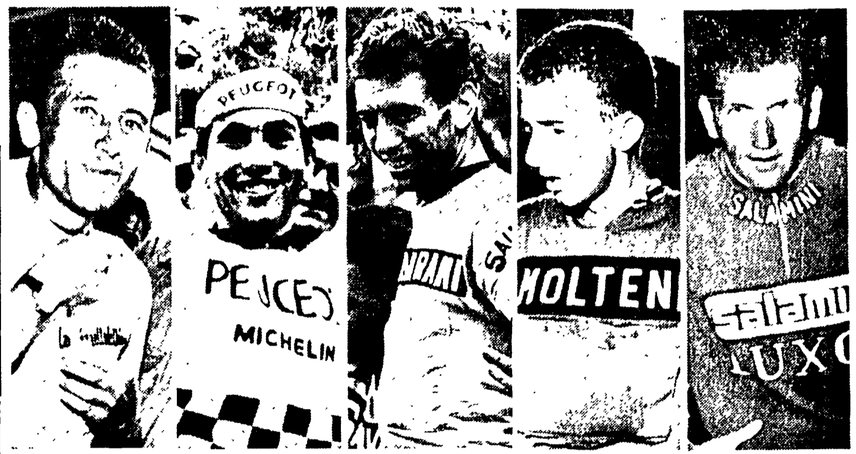
I maggiori protagonisti del Giro d'Italia del cinquantenario saranno quasi sicuramente ANQUETIL, MERCKX, GIMONDI, MOTTA e ADORNI