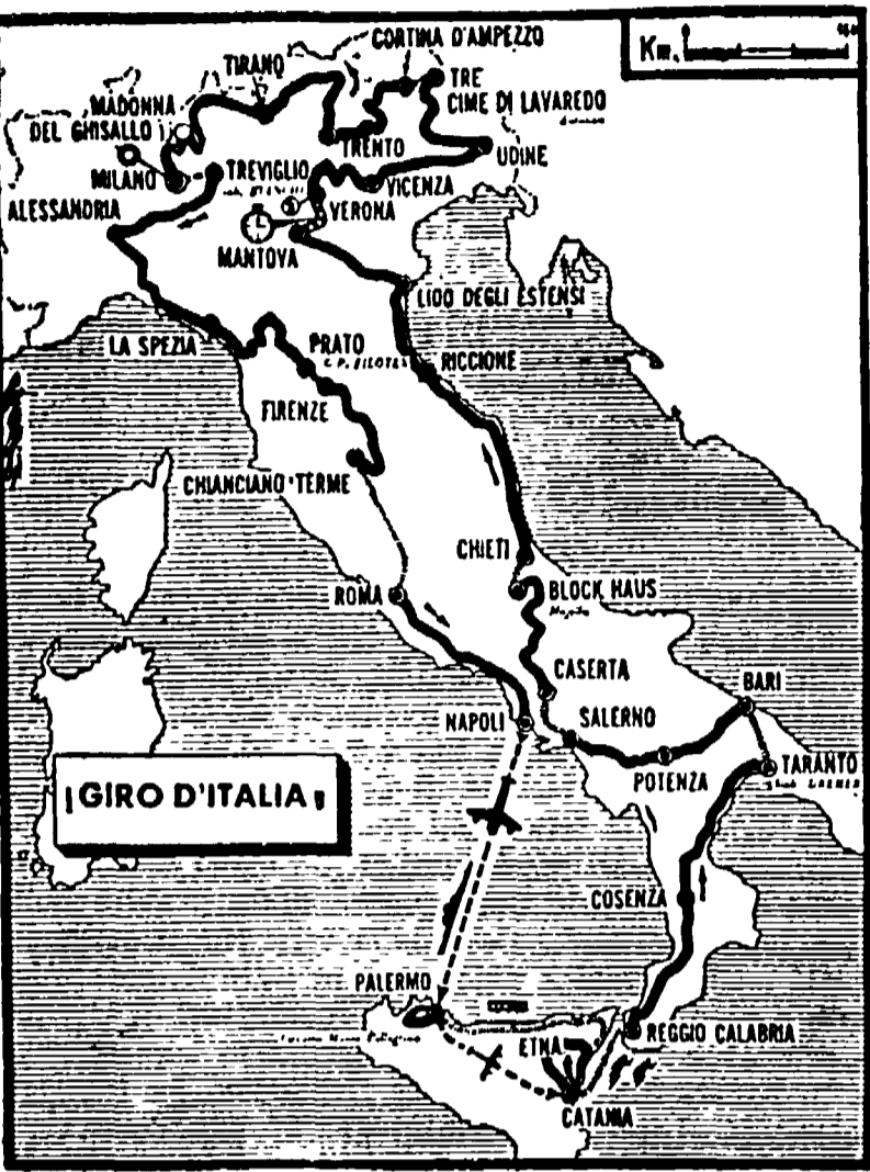
Il grafico del 50. Giro d'Italia