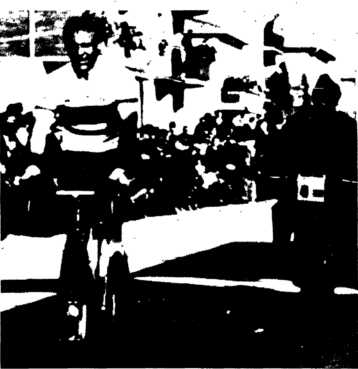
ALTIG ha ottenuto a Salerno la seconda vittoria di tappa

Nessun mutamento nella classifica generale — Adorni cade, ma recupera e giunge con il gruppo — Oggi quattro traguardi per il G.P. della Montagna