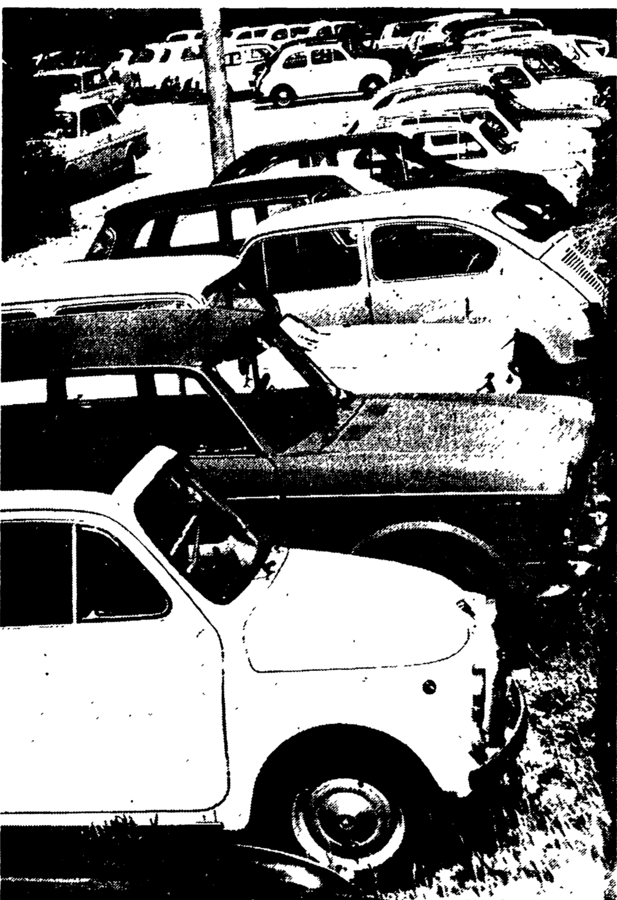
Così i parcheggi all'interno della tenuta di Castelporziano. Le macchine sono affiancate l'una accanto all'altra e non c'è più neanche il posto per una bicicletta. I parcheggi però quest'anno non sono stati ancora coperti e migliaia di automobilisti ieri, al momento del rientro, hanno dovuto soffrire per infilarsi nelle vetture arroventate dai raggi infuocati.

La spiaggia libera invasa da quindicimila bagnanti — I parcheggi interni si sono riempiti in pochi minuti: molte auto abbandonate per strada Caos alle stelle nel traffico — Alcune lamentele: l'arenile-pattumiera e i parcheggi senza tettoie — Pic-nic generale in riva al mare