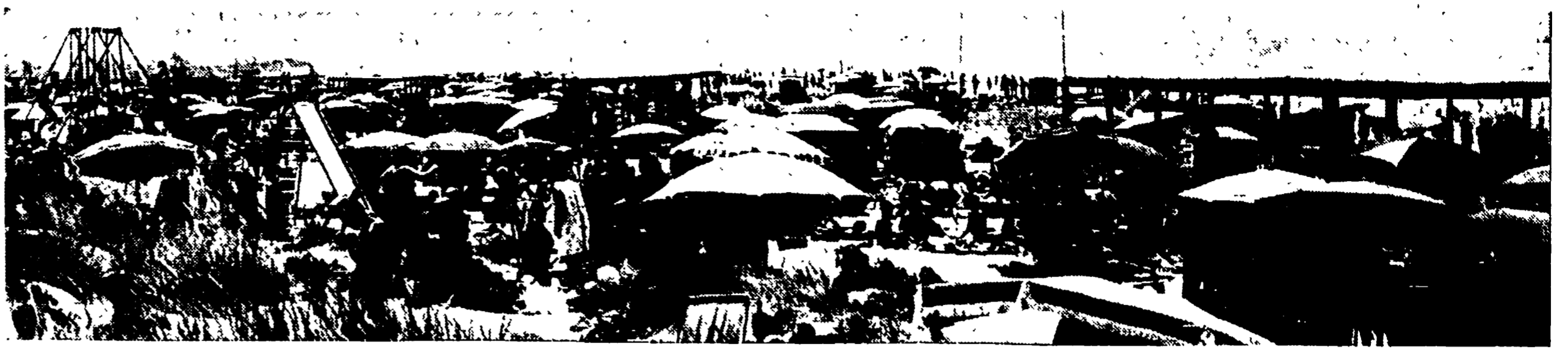
Così alle 12 di ieri la spiaggia libera di Castelporziano: dappertutto sono disseminati gli ombrelloni e le tende delle migliaia di bagnanti che hanno invaso l'arenile