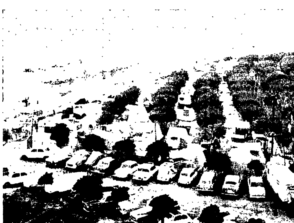
Completo contatto con la natura nel camping di Ceriale in Liguria.

Si può dire, insomma, che ormai, con una tenda non grande e di prezzo abbastanza contenuto, è possibile un campeggio di qualità. La spesa, anche nei migliori e più attrezzati terreni da camping (che sono forniti come nota, di acqua, elettricità, servizi igienici, spacciaveri) non supera le tre-quattrocento lire al giorno a persona, escluso il consumo di cibo e la spesa per i pasti.