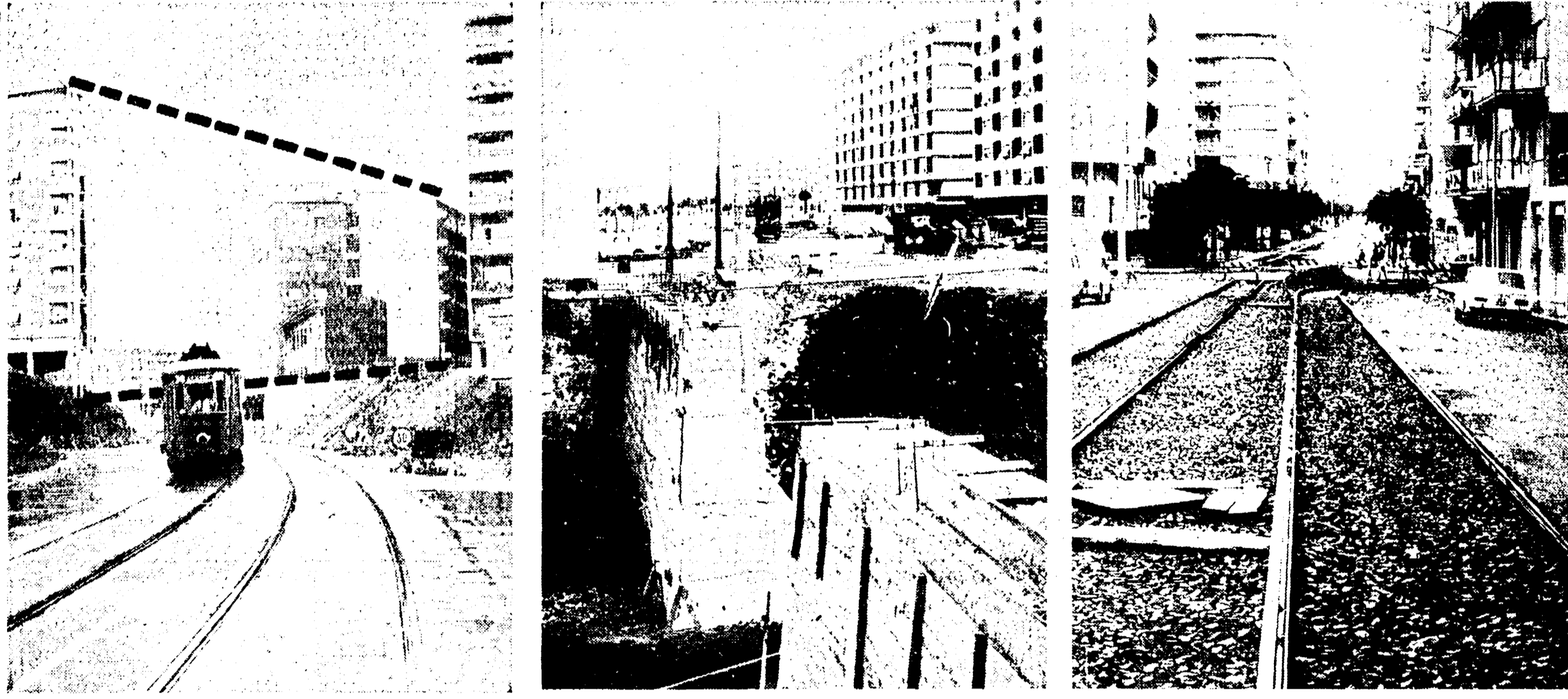
VIA BENZONI La linea tratteggiata indica l'area che presumibilmente verrà occupata dalla nuova costruzione. La strada, di conseguenza, verrà bloccata e scomparirà.

Un «casermone» bloccherà tra poco tutta la zona — L'ATAC sta già lavorando per spostare le linee — Commenti e polemiche — In via Badoero i commercianti sono in attesa della «fermata» — Il Comune che cosa ha da dire?