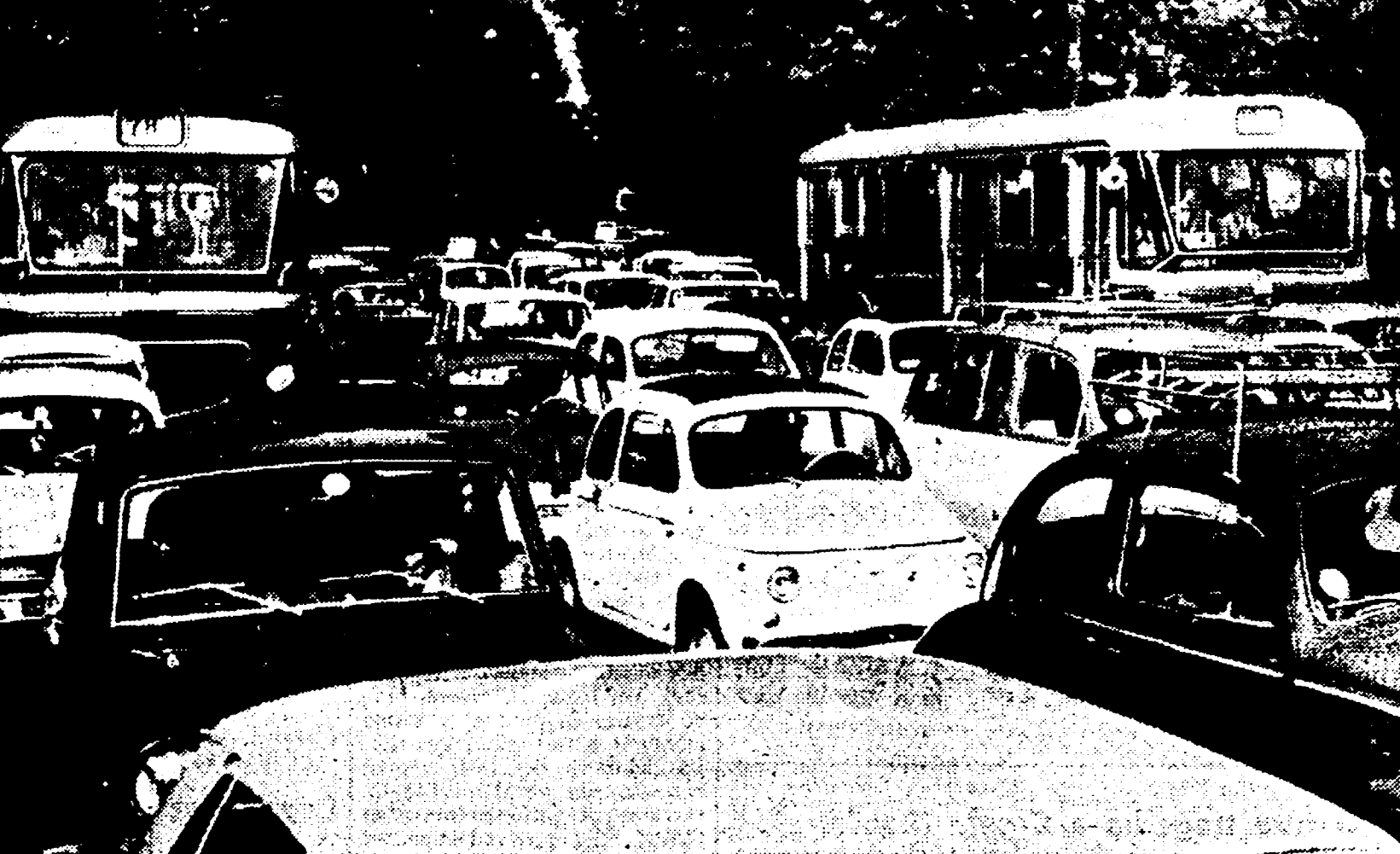
Così ieri il traffico nella zona di Ponte Matteotti, nel nuovo tratto interessato all'onda verde».