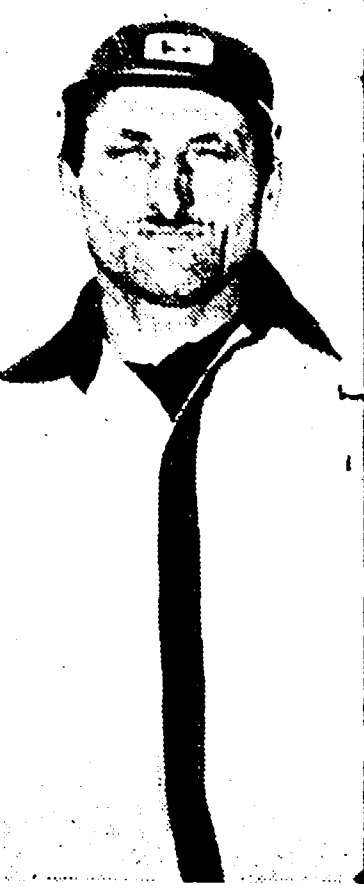
Il distributore di benzina... Rapinato il benzinaio... Aveva circa vent'anni, un berretto calato sugli occhi...