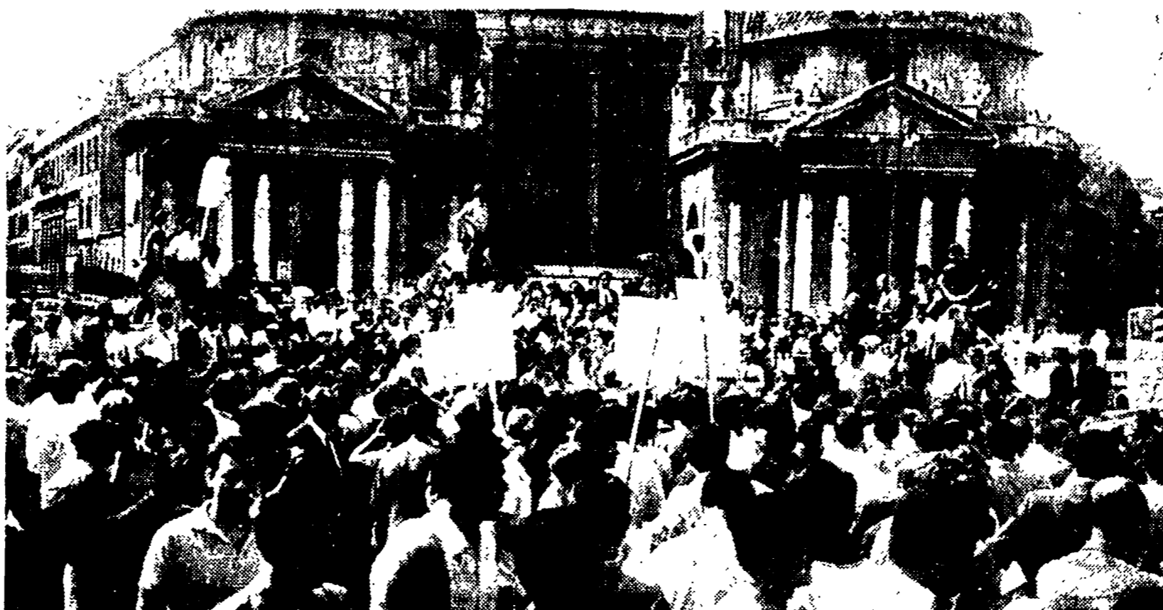
Gli ospedalieri manifestano in piazza del Popolo a conclusione del corteo.

Infermieri, impiegati, tecnici, ausiliari con decine di cartelli — «Il costo della vita aumenta, i salari mai» — «Costruite ospedali a Roma» — «Basta con la gestione commissariale» — La posizione dei sindacati illustrata nel comizio e in una conferenza stampa — Assicurazioni del ministro per la lettera di rappresaglia — Interrogazione comunista a Mariotti