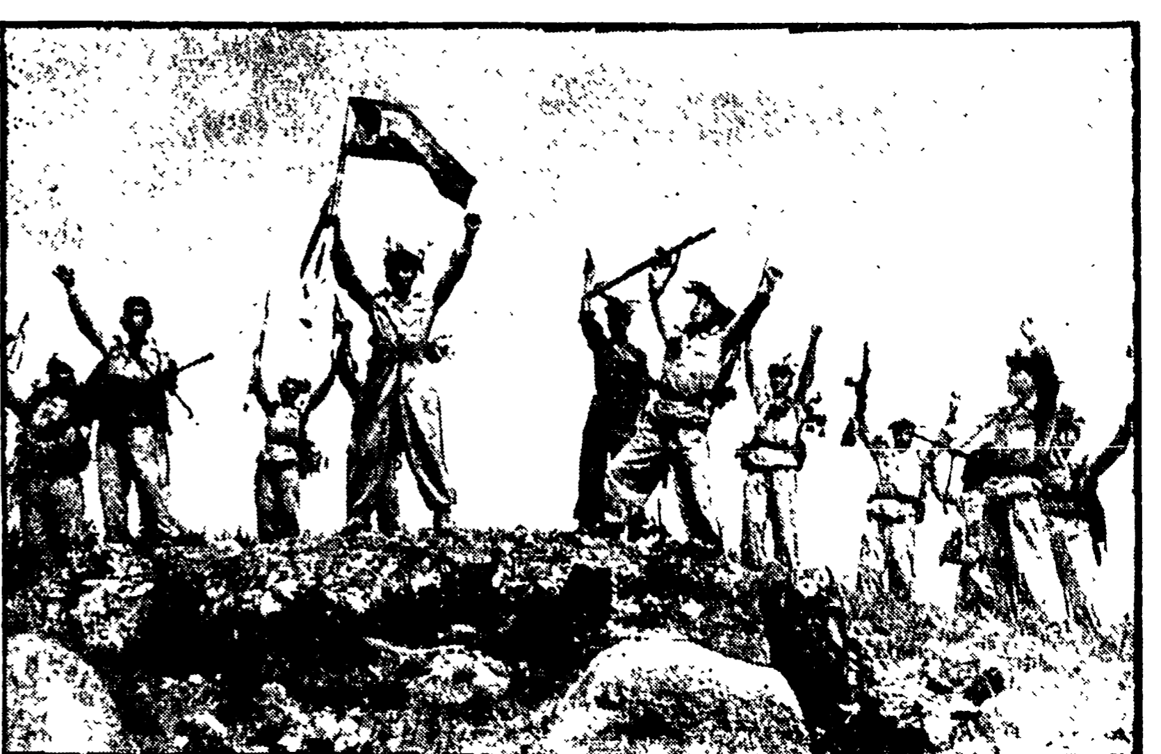
Un gruppo di soldati nordcoreani esulta dopo una vittoriosa battaglia contro gli americani

Dalla faziosità di «Memorie del nostro tempo» ai documenti di uno storico USA