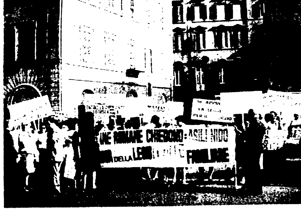
Una delegazione di donne dei vari circoli UDI di Roma ha consegnato ieri ai rappresentanti del Parlamento migliaia di cartoline raccolte nelle varie zone della città nel corso di un referendum indetto dalla rivista «Noi donne» sui problemi più urgenti per la tutela e l'emancipazione della donna...