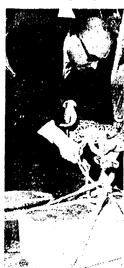
PESARO, 30. Sono iniziati i lavori per la costruzione di due nuove scuole materne nei quartieri di Montegrano e Fontana Villa Andrea.

Un fatto ormai acquisito che l'amministrazione comunale di Pesaro sta all'avanguardia in questo settore dell'istruzione pubblica per il quale, destinata annualmente circa 120 milioni (spesa che viene immanicabilmente tagliata) per un quarto alla Comunità Centrale per la Finanza Centrale. Le due nuove scuole materne che entreranno in funzione nel prossimo anno scolastico disporranno di due aule ciascuna, potranno ospitare circa 120 bambini. Attualmente le scuole materne gestite dal Comune sono venti, frequentate da circa 1140 bambini.