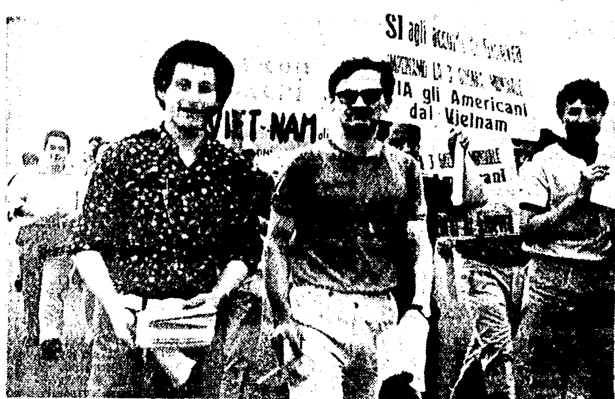
Si agita la marcia per la pace da Ancona a Arcevia. In alto: gli americani dal Vietnam