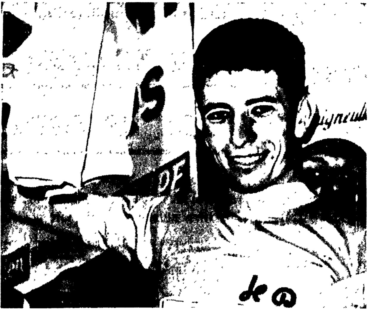
Gimondi ha respinto l'attacco di Almar: risentirà dello sforzo sostenuto?