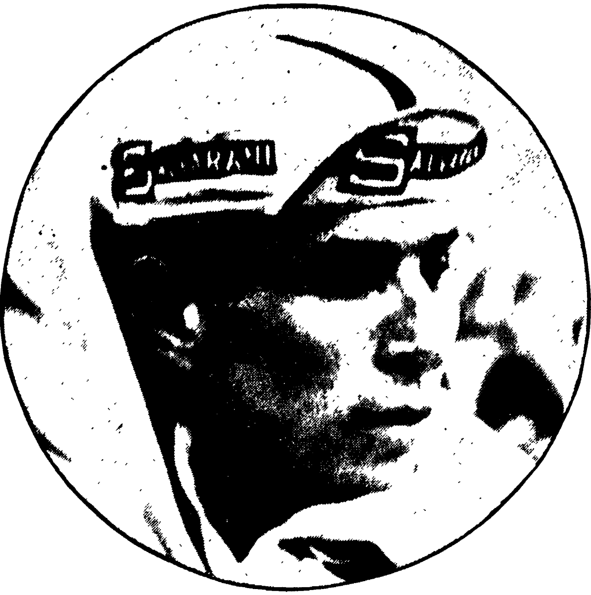
GIMONDI è stato uno dei protagonisti della corsa di Roubaix