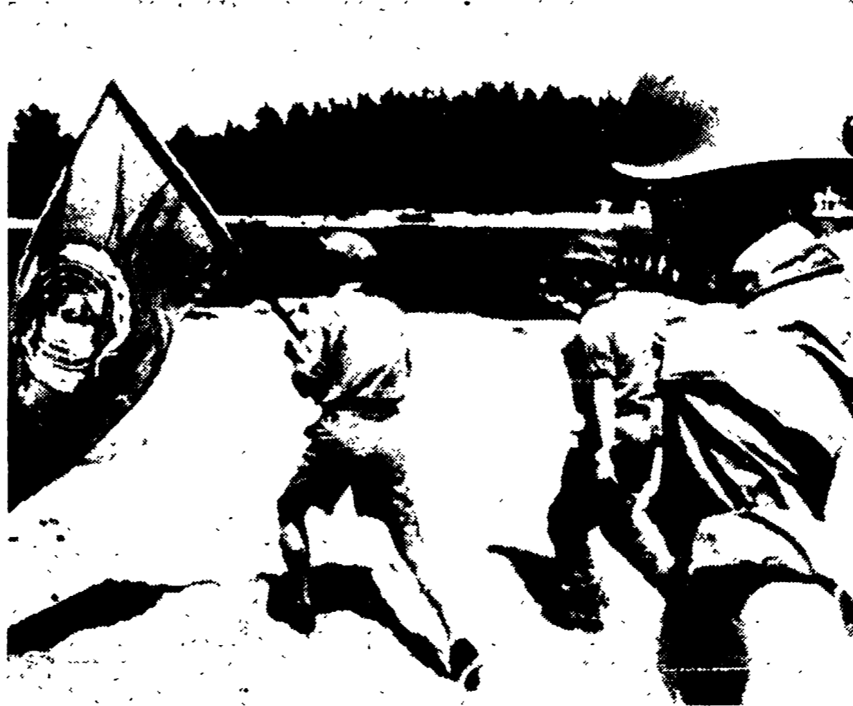
ISMAILIA — Il maggiore Torbjorn Egerstad, uno degli osservatori dell'ONU, accompagnato da ufficiali israeliani cammina lungo la riva orientale del Canale di Suez tenendo in mano una bandiera delle Nazioni Unite